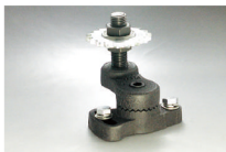
FLR + ID + SPB