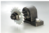
ST-S + ID + SPB