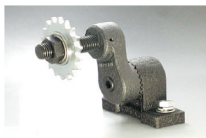
ST-R + ID + SPB