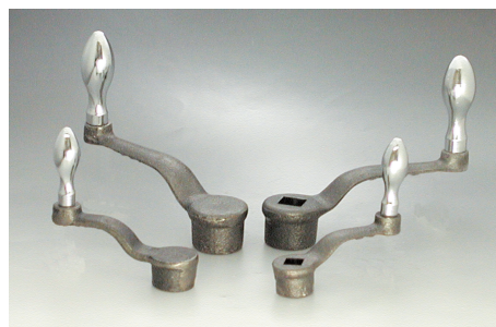
OA-N + AS