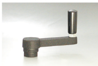
ACH-N + ER