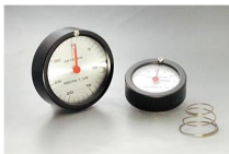
ダイヤル・インジケーター構造図